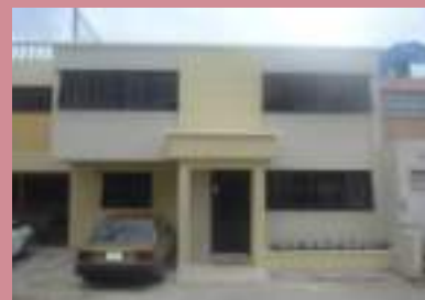
Paz y la Cooperación-IEPC