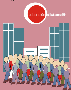
CURSO SEMIPRESENCIAL DE FORMACIÓN DE TUTORES A DISTANCIA 2007

h.-Colabora: Universidad Autónoma del Estado de Hidalgo-México